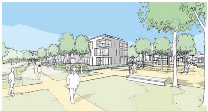
Anerkennung: Erich W. Baier Architektur + Städtebau, Gauting mit hermanns landschaftsarchitektur/umweltplanung, Schwalmtal