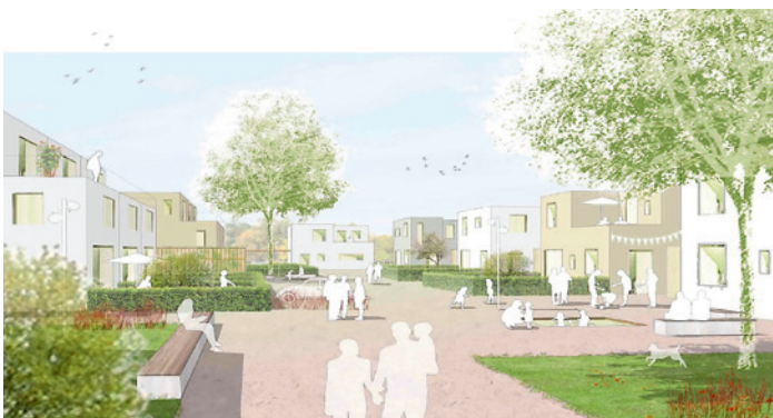
Anerkennung: Holl Wieden Partnerschaft, München mit [f] landschaftsarchitektur gmbh, Solingen