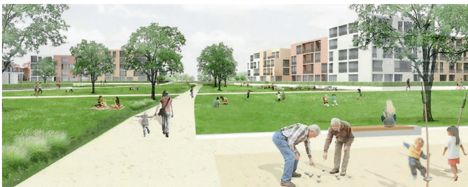
2. Preis: Thomas Schüler Architekten Stadtplaner, Düsseldorf mit faktorgruen Landschaftsarchitekten, Freiburg

mensschichten. 20 bis 25 Prozent der Wohnbauflächen sind dabei für den geförderten Wohnungsbau reserviert. Auch Gewerbeflä-