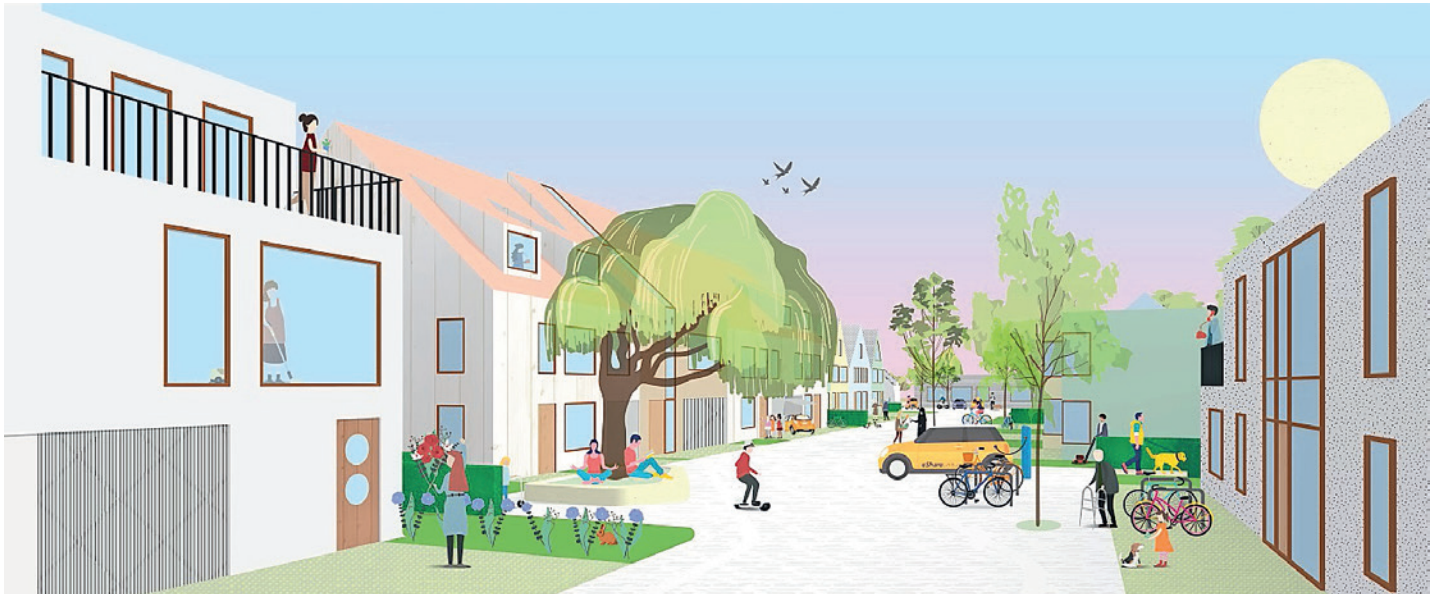
1. Preis: Studio Schultz Granberg GbR mit häfner jiménez betcke jarosch landschaftsarchitektur gmbh, beide Berlin