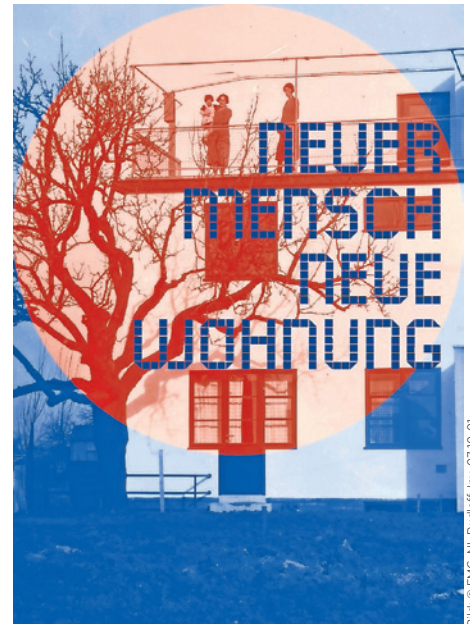
Siedlung Höhenblick um 1928

Dienstag, Donnerstag bis Sonntag 11 – 18 Uhr Mittwoch 11 – 20 Uhr Montag geschlossen